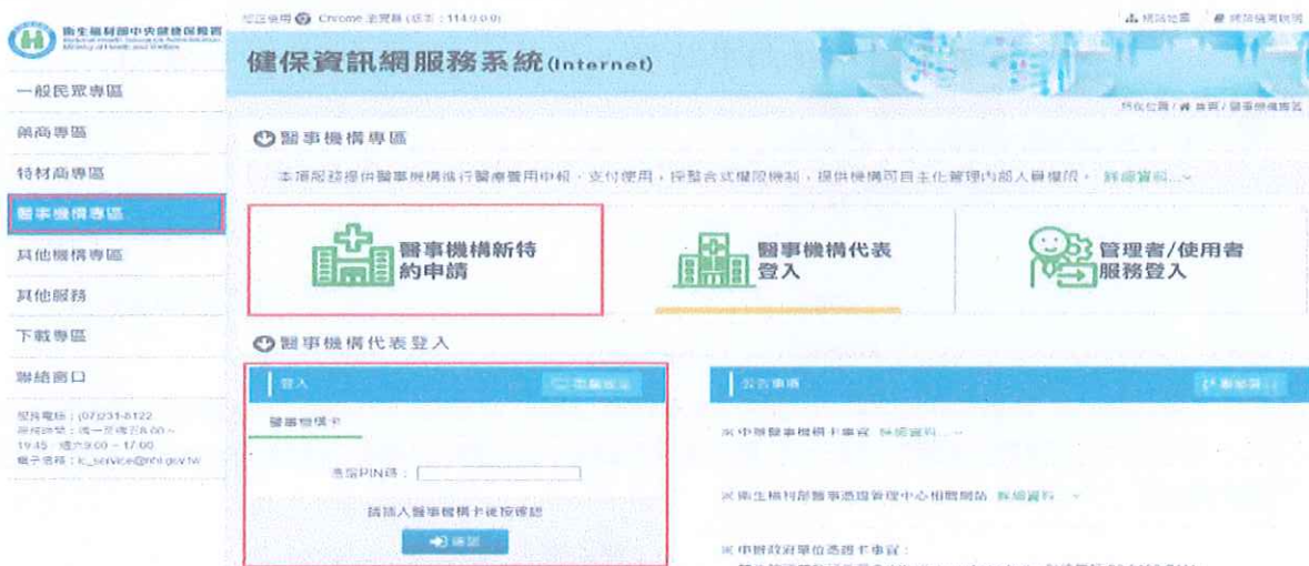
圖-1 健保資訊網服務系統 (Internet) 首頁

(一) 進入健保資訊網(Internet)服務平台後選擇「醫事機構專區」，然後點選「醫事機構新特約申請登入」如圖-1，進入如下畫面的「HMAE2101S01_醫事機構新特約申請登入作業」如圖-2。